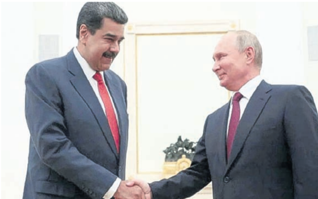
Nicolas Maduro a papia diamars tocante e combersacion telefonico cu e tabatin cu presidente di Rusia, Vladimir Putin, unda cu el a

bolbe keha di e accionnan desestabilizador di OTAN y Merca.